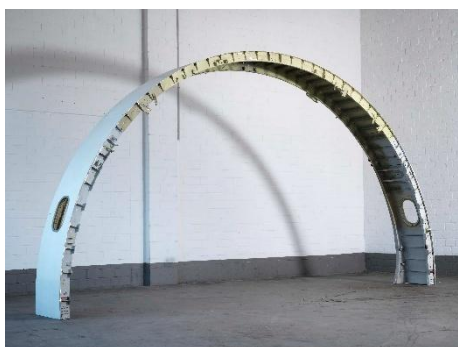
Michail Pirgelis, „UNIVRS“, 2012/2018, Aluminium, Titan, Lack, 305 × 556 × 62 cm, © Michail Pirgelis, courtesy des Künstlers/Sprüth Magers.

Michail Pirgelis, 'Perforated Past', 2020, aluminium, titanium, lacquer, 57.5 × 53.5 × 5 cm, © Michail Pirgelis, courtesy of the artist/Sprüth Magers, Photo Ben Hermanni.