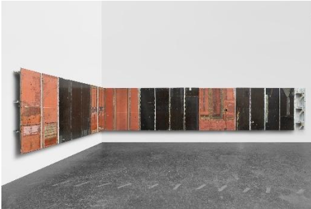
Michail Pirgelis, „China Girl“, 2019, Aluminium, Fiberglas, Titan, Lack, Gummi, Klebeband, 154 × 1042 × 22 cm, © Michail Pirgelis, courtesy des Künstlers/Sprüth Magers, Foto Mareike Tocha.