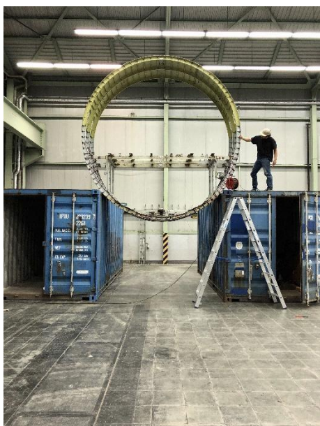
Michail Pirgelis bei der Installation seiner Arbeit „Memory Games“ (2017) für die Ausstellung „RAW“, DuMont Kunsthalle, Köln, 2019, © Michail Pirgelis, courtesy des Künstlers/Sprüth Magers.