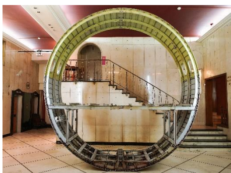
Michail Pirgelis, „Memory Games“ (2017), Installationsansicht „ANTI“, Athens Biennale, Athen, 2018