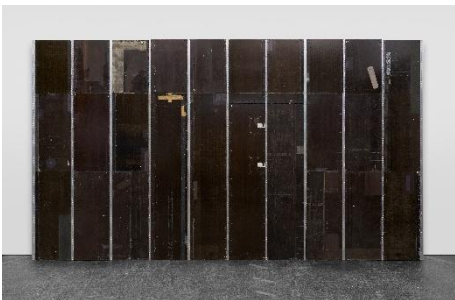
Michail Pirgelis, „Desert Star I“, 2022, Aluminium, Fiberglas, Titan, Lack, Klebeband, 300 × 534 × 22 cm, © Michail Pirgelis, courtesy des Künstlers/Sprüth Magers, Foto Ben Hermanni.