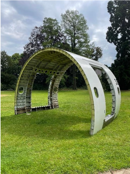
Michail Pirgelis, „ECHO“, 2022, Aluminium, Titan, Lack, Silikon, 308 × 490 × 290 cm, Installationsansicht „Terra incognita - Fragen an die Erde“, Lantz'sche Skulpturenpark 2022, © Michail Pirgelis, courtesy des Künstlers/Sprüth Magers, Foto Tino Kukulies.