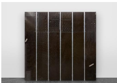
Michail Pirgelis, „Desert Star II“, 2022, Aluminium, Fiberglas, Titan, Lack, Klebeband, 300 × 312 × 21 cm, © Michail Pirgelis, courtesy des Künstlers/Sprüth Magers, Foto Ben Hermanni.

Michail Pirgelis, 'Desert Star II', 2022, aluminium, fibreglass, titanium, lacquer, tape, 300 × 312 × 21 cm, © Michail Pirgelis, courtesy of the artist/Sprüth Magers, Photo Ben Hermanni.