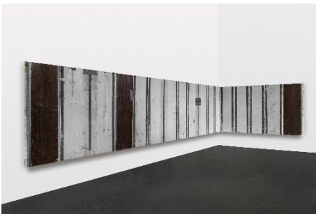
Michail Pirgelis, „No Dancing in the Aisles“, 2020, Aluminium, Fiberglas, Klebeband, 152 × 954 × 20 cm, © Michail Pirgelis, courtesy des Künstlers/Sprüth Magers, Foto Mareike Tocha.