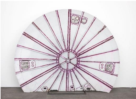
Michail Pirgelis, „LOST“, 2022, Aluminium, Titan, Lack, Silikon, 338 × 338 × 80 cm, © Michail Pirgelis, courtesy des Künstlers/Sprüth Magers, Foto Timo Ohler.