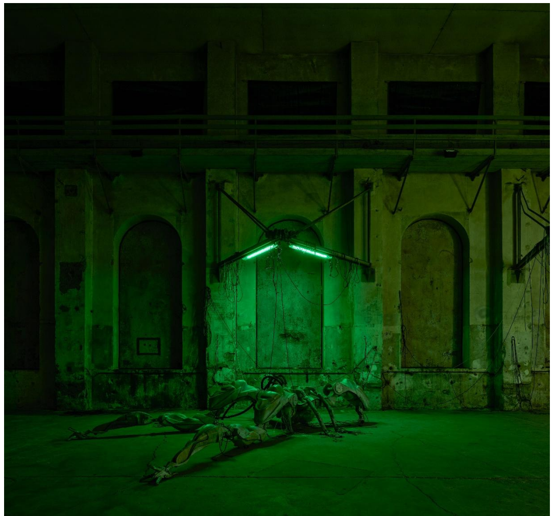
Davide Allieri: 47°24'35''N / 9°44'20''E, Kunstraum Dornbirn 2026, Foto Günter Richard Wett, courtesy des Künstlers/Galerie Hubert Winter.

Davide Allieri , geboren 1982 in Bergamo, lebt und arbeitet in Mailand, Italien. Der Künstler absolvierte sein Studium an der Accademia di Belle Arti di Brera in Mailand. Seine Werke wurden in zahlreichen Institutionen und Ausstellungsräumen gezeigt, darunter im Kunstmuseum Den Haag („New New Babylon – Visions for Another Tomorrow“, 2025), der Triennale Milano („After All“, Einzelausstellung, 2024), der Galerie Hubert Winter in Wien („CELLS“, Einzelausstellung, 2023), dem Palazzo Monti in Brescia („HOLDER“, Einzelausstellung, 2023), dem House, Berlin („Very friendly“, 2023), im DAS Ausstellungsraum in Mailand („BUIA 1:31“, 2019) und in Projekten der Kraupa-Tuskany Zeidler Galerie in Berlin („NEXUS“, 2024). 2024 erhielt er zusammen mit der Galerie Hubert Winter den viennacontemporary | Bildrecht SOLO Award.