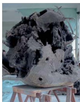
Atelieransicht; Buggenhout „The blind leading the blind #14“, 2007 Sammlung Axel Vervoord, Antwerpen, Belgien