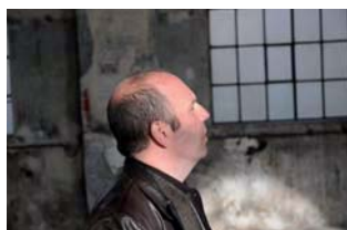
Peter Buggenhout im Kunstraum Dornbirn