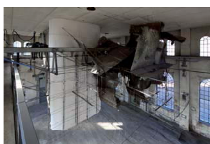
Ausstellungsansicht; Buggenhout „Caterpillar logic“