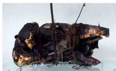
Buggenhout "Eskimo Blues #2", 1999 Saatchi Collection, London