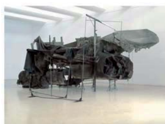
Buggenhout, "The blind leading the blind", 2009 Rubell Family Collection, Miami, Florida