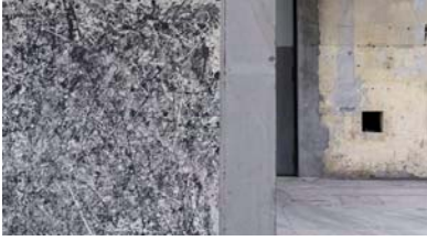
Ausschnitt Ausstellungsansicht: Klaus Mosettig „Nature morte“, Kunstraum Dornbirn Dateiname: Mosettig_Detail Ausstellungsansicht_1.7MB.jpeg