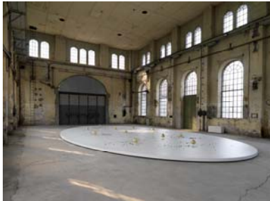
Ausstellungsansicht 1