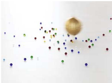
Ausstellungsansicht 4