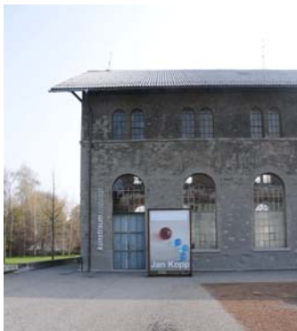
Montagehalle Außenansicht